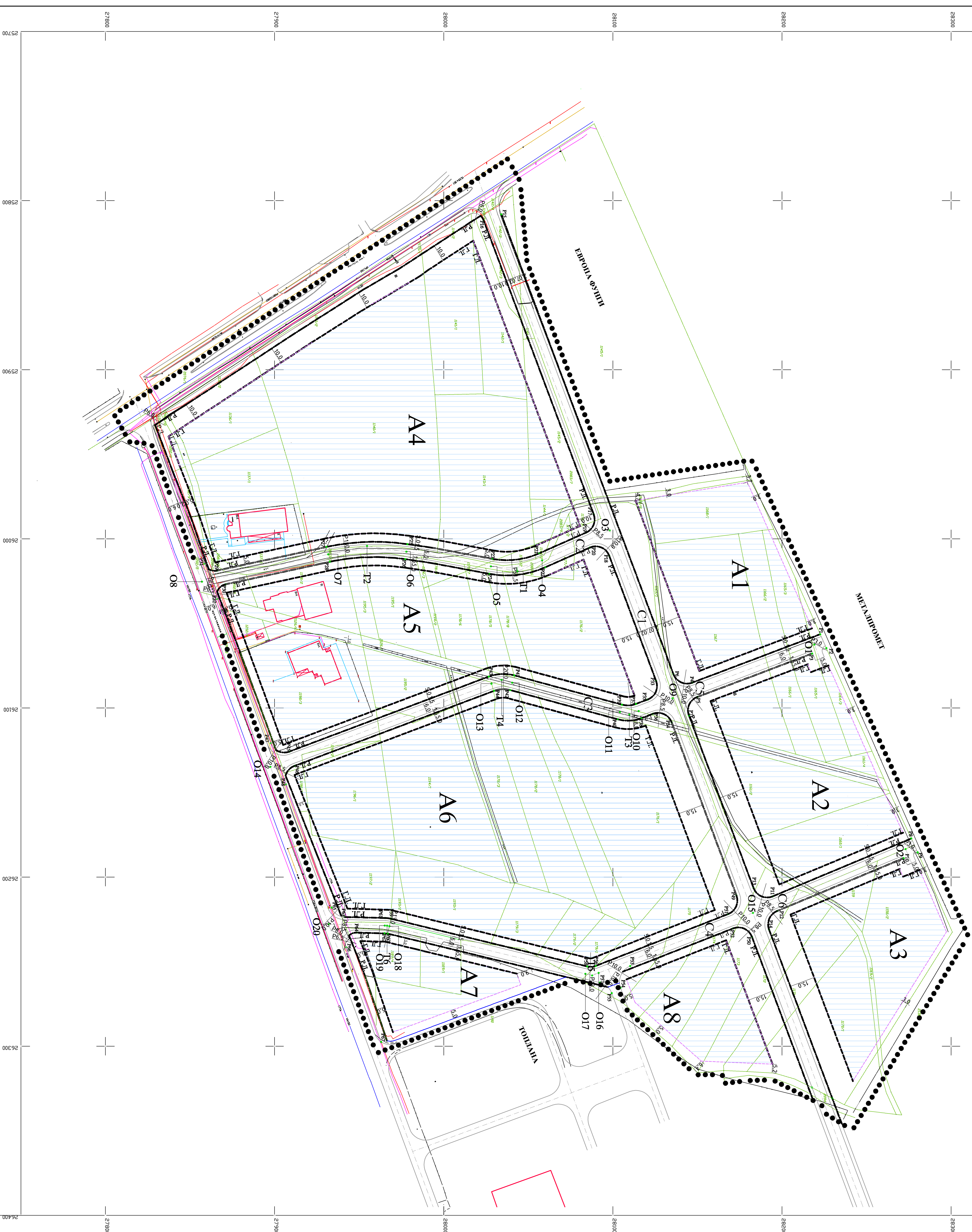
КОРДИНАТЕ ОСОВНИХ ТАЧКА